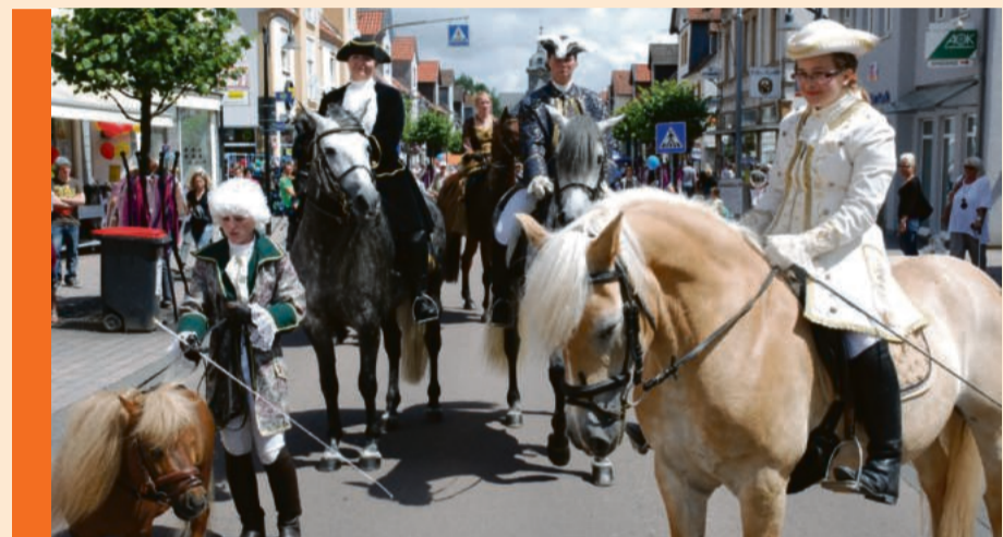
Beim verkaufsoffenen Sonntag während der Barockfestspiele ist immer ein munteres Treiben in Bad Arolsen.

Im Bad Arolser Handel, Handwerk und Gewerbe e.V. (HHG) sind mehr als 70 Mitgliedsbetriebe organisiert. Der 1958 gegründete Verein zeichnet für viele Aktionen und Veranstaltungen wie den Weihnachtsmarkt, das Weinfest oder den Sonntag zu den Barockfestspielen mit verkaufsoffenem Sonntag verantwortlich. Darüber hinaus beteiligt sich der HHG am verkaufsoffenen Sonntag „Bad Arolsen blüht auf“ und ist Mitinitiator des Projekts AroMarkt – dem Onlinehandel der Bad Arolser Händlerschaft. Seinen Mitgliedern bietet der Verein eine gute Vernetzung untereinander und mit der Stadt, aktive Begleitung bei Neugründungen, die Organisation von Stadtfesten und verkaufsoffenen Sonntagen sowie wöchentlich feste Beratungsstunden in der HHG-Geschäftsstelle.