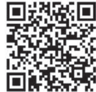
iOS (Apple z. B. iPhone)