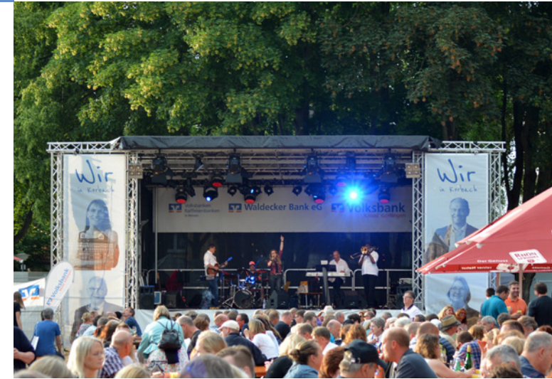
Hessestag in Korbach

Waldecker Bank eG Prof.-Bier-Straße 18 34497 Korbach www.waldecker-bank.de